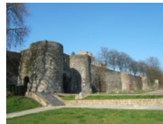
Rempart entourant la vieille ville de Boulogne