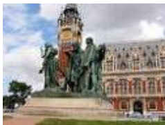
Hôtel de ville de Calais

En fin d'après midi en route pour rejoindre le littoral pour un hébergement sur Calais.